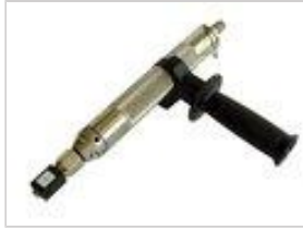
Handstempelgerät PHSG 3, pneumatisch