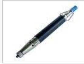
Handstempelgerät PHSG 1, pneumatisch