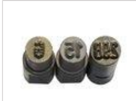
Embouts gravés pour appareils de marquage manuels