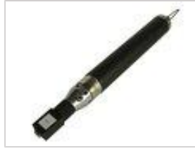
Handstempelgerät PHSG 2, pneumatisch