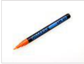
GIMARK Lackmarker LM20